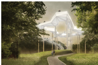
geskes.hack Landschaftsarchitekten, Kolb Ripke Architekten