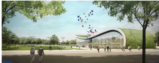
© Seilbahn Blumberger Damm LEITNER ropeways Kolb Ripke Architekten