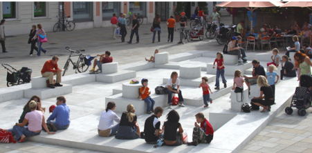
Plac miejski na starym mieście w Regensburgu