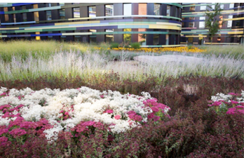
Budynek Urzędu Rozwoju Miasta i Środowiska miasta Hamburg