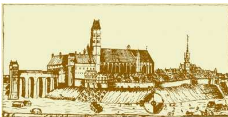
Panorama miasta wg H. Ogiera z ok. 1700 r. (publikacja Miejski Serwis Internetowy)

wraz z koncepcją zagospodarowania terenu