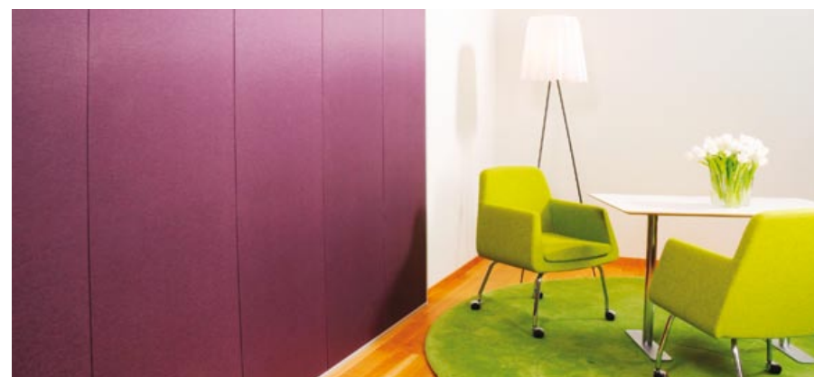
PANELE ŚCIENNE TEXONA C W KOLORZE FIOLETOWYM

Stworzony z myślą o wnętrzach, gdzie akustyka wymaga natychmiastowej poprawy, bez ingerencji w strukturę budynku. Jest to swobodnie wiszący panel sufitowy, który mocuje się do stropu przy pomocy estetycznych, regulowanych wieszaków linkowych. Dookoła płyty nie przebiegają profile, co daje czysty, minimalistyczny efekt. Panel wykonany jest z wełny szklanej o wysokiej gęstości i wykończony powłoką Akutex FT, co pozwala uzyskać najwyższą klasę pochłaniania dźwięku (A). Zarówno krawędzie, jak i tylna strona płyty są malowane, co umożliwia instalację pod różnymi kątami. Dostępne formaty: 1200x1200x40 mm oraz 2400x1200x40 mm w kolorze White Frost 500.