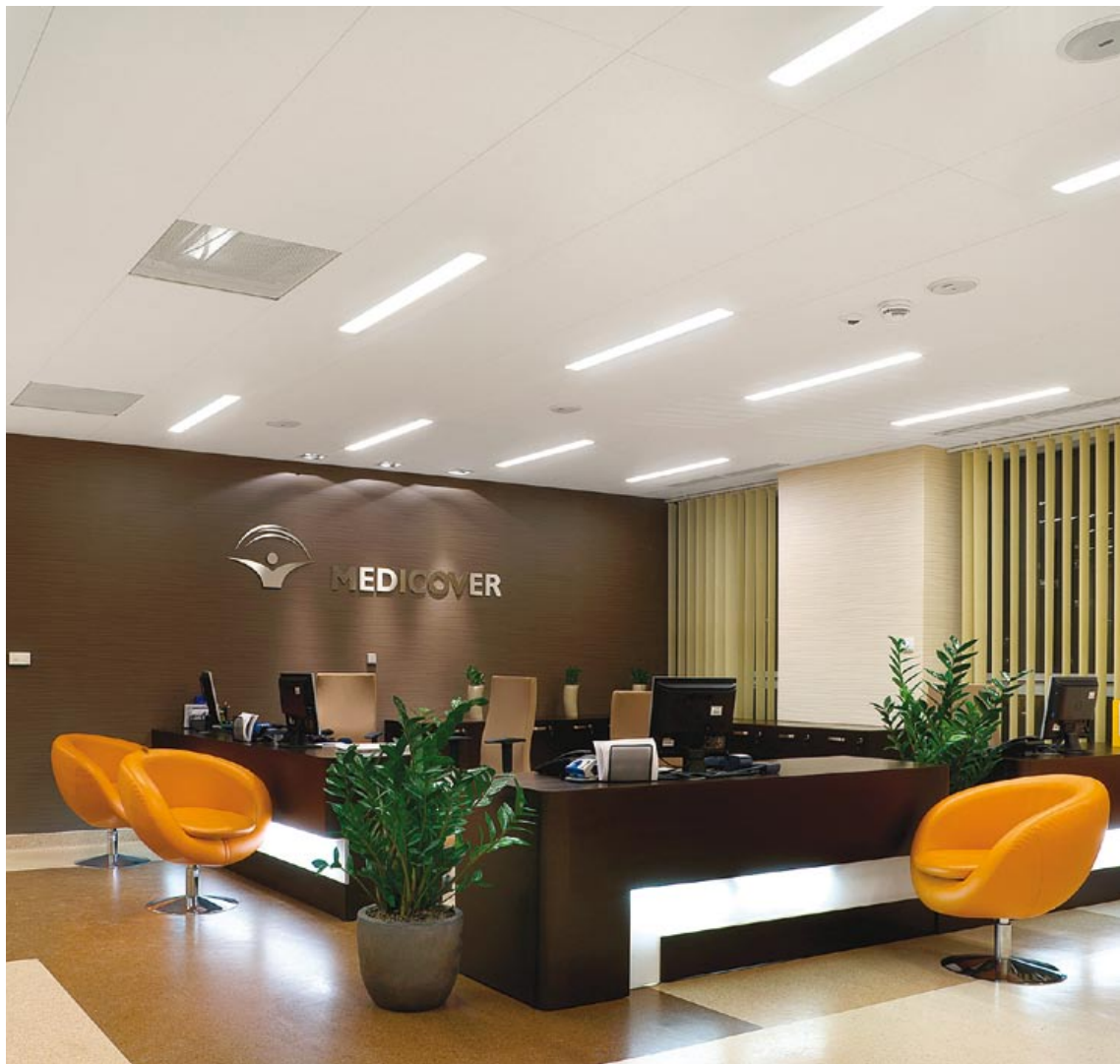
ECOPHON FOCUS DS. I OPRAWY ECOPHON LINE, CENTRUM MEDICOVER, WROCŁAW.

Na komfort wnętrza składa się jego estetyczne i funkcjonalne meblowanie, odpowiednie oświetlenie i środowisko akustyczne. Popularność twardych, odbijających dźwięk materiałów, jak szkło czy kamień, coraz więcej źródeł hałasu i efektywne wykorzystanie przestrzeni sprawia, że kwestia akustyki wnętrza staje się coraz bardziej istotna. Ecophon oferuje dźwiękochłonne sufity podwieszane i panele ściennie w różnych rozmiarach, kolorach i kształtach, zintegrowane z nimi systemy oświetleniowe i akcesoria. Rozwiązania, które sprawiają, że sufit jest żywą, interesującą płaszczyzną, zapewniającą sprzyjające warunki do pracy i odpoczynku.