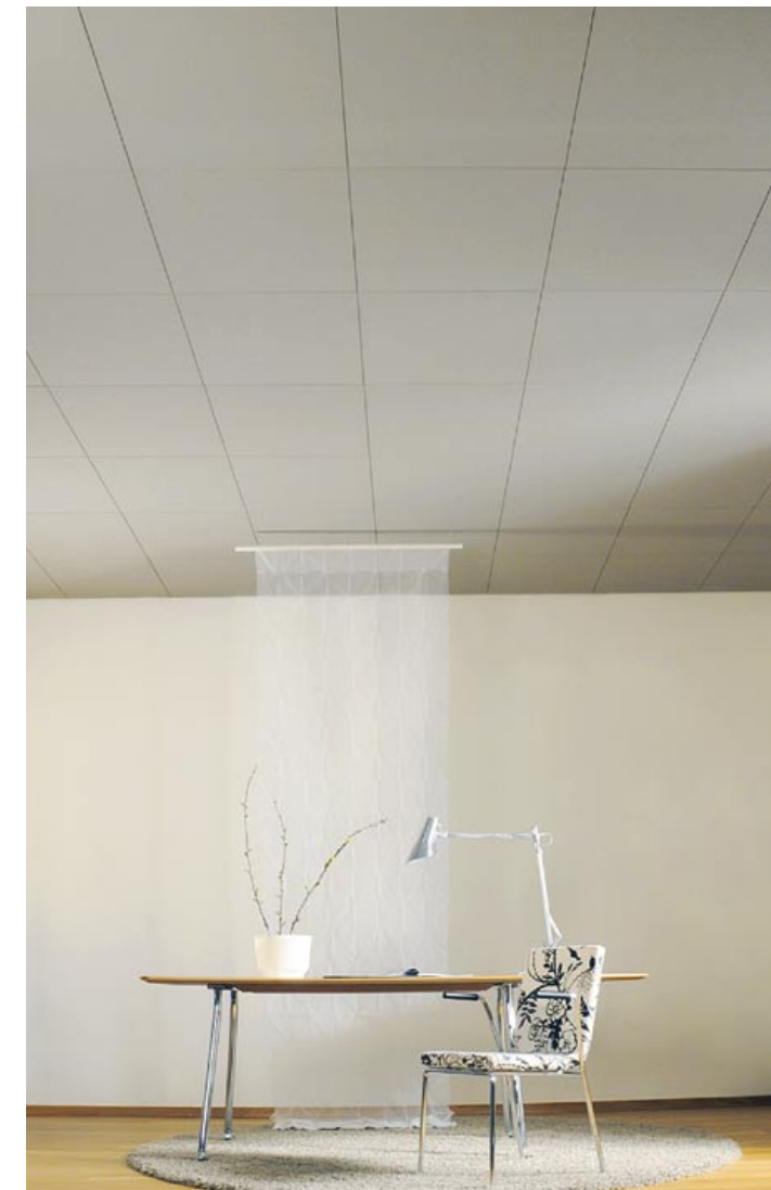
ECOPHON FOCUS DS. W KOLORZE SILVER SHADOW

Wykonane z wełny szklanej, pokryte są mocną tkaniną z tego samego surowca. Mogą być alternatywą lub uzupełnieniem sufitów dźwiękochłonnych. Bogata kolorystyka paneli (m.in. fiolet, beż, brąz, pomarańcz, czerwień, turkus, trzy odcienie szarości) umożliwia swobodne poruszanie się w każdej stylistyce wnętrza. Specjalne profile i narożniki, dzięki symetrii końców, można łączyć w dowolny sposób. Ich kolorystyka (szary, biały i czarny) umożliwia stworzenie subtelnego lub wyraźnego obramowania. Panele dostępne są w wymiarach 2700x600x40 mm (krawędź A) oraz 2700x1200x40 mm (krawędź C).