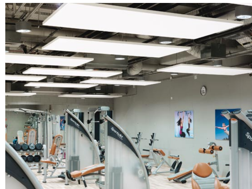
CALYPSO FITNESS, UL. POSTĘPU, WARSZAWA

Stworzony z myślą o wnętrzach, gdzie akustyka wymaga natychmiastowej poprawy, bez ingerencji w strukturę budynku. Jest to swobodnie wiszący panel sufitowy, który mocuje się do stropu przy pomocy estetycznych, regulowanych wieszaków linkowych. Dookoła płyty nie przebiegają profile, co daje czysty, minimalistyczny efekt. Panel wykonany jest z wełny szklanej o wysokiej gęstości i wykończony powłoką Akutex FT, co pozwala uzyskać najwyższą klasę pochłaniania dźwięku (A). Zarówno krawędzie, jak i tylna strona płyty są malowane, co umożliwia instalację pod różnymi kątami. Dostępne formaty: 1200x1200x40 mm oraz 2400x1200x40 w kolorze White Frost 500.