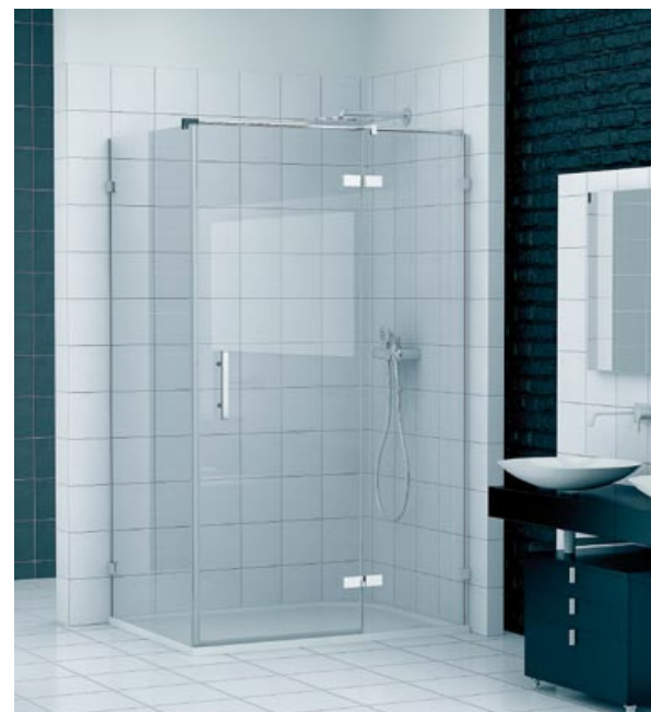
KABINA Z SERII PUR