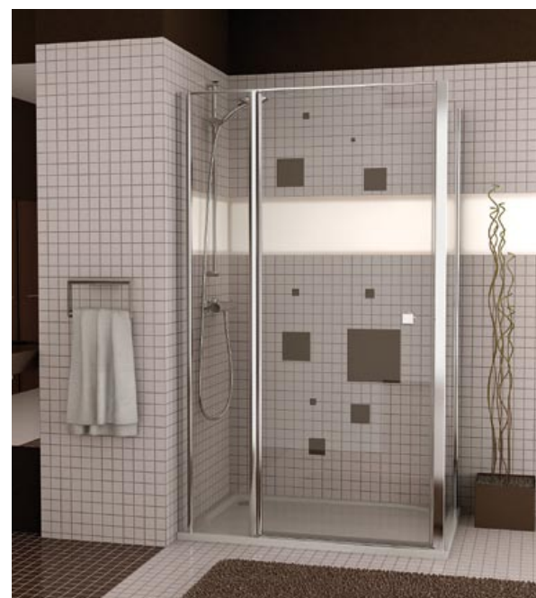
KABINA Z SERII SWING-LINE