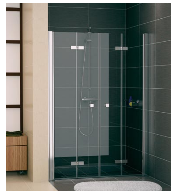
KABINA Z SERII SWING-LINE-F

Kabina z serii SWING, model SLT13+SLT1, wyposażona w 6 mm szkło hartowane, uszczelki magnetyczne i listwę progową, otwierana na zewnątrz i do wewnątrz, powłoka zabezpieczająca szkło Aqua Perle.