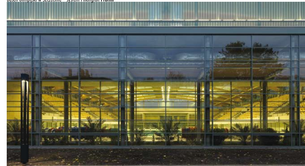
Basen olimpijski w Szczecinie – system Pilkington Profilit™

Różnorodność asortymentu szyb marki Pilkington otwiera szeroką gamę ich zastosowań, począwszy od zwykłych szyb stosowanych w stolarcze okiennej dla budownictwa mieszkaniowego, poprzez szklane fasady i dachy biurowców oraz obiektów użyteczności publicznej, aż po elementy wystroju wnętrz, jak np. ścianki działowe, drzwi, podłogi, czy meble.