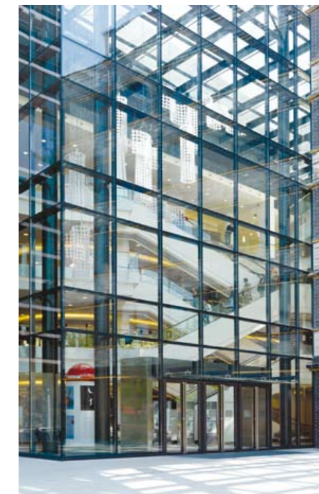
Dom Handlowy Renoma we Wrocławiu – szkło Pilkington Suncool™ 70/40 OW