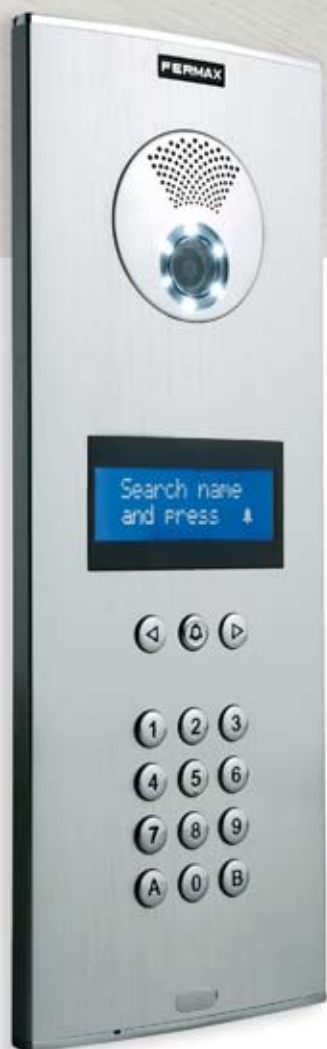
Panel Cityline Digital