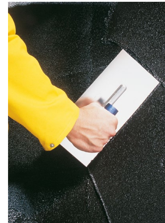
ZAAWANSOWANE MATERIAŁY DO HYDROIZOLACJI Z TECHNOLOGIĄ DEITERMANN

Materiały Weber są wytwarzane w 8 zakładach produkcyjnych na terenie Polski. Nasze największe fabryki są zlokalizowane w Gdyni, Górze Kalwarii, Ostrowcu Świętokrzyskim, Wrocławiu oraz w Gniewie, gdzie znajduje się zakład produkcji keramzytu. Weber ma także kilka terminali logistycznych z centrami barwienia, dzięki czemu udaje nam się obniżyć koszty i ograniczyć emisję CO 2 powstałego w procesie transportu drogowego.