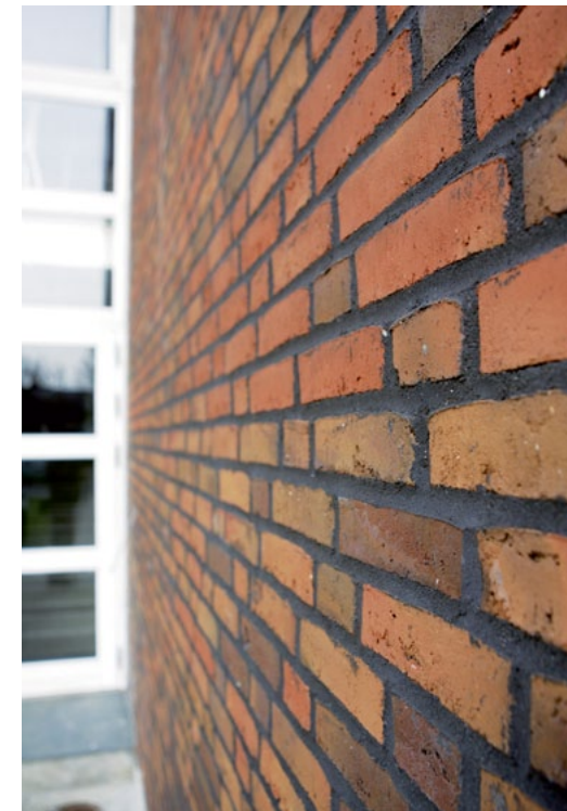
SYSTEMY DO RENOWACJI I NAPRAW FASAD ORAZ ŚCIAN